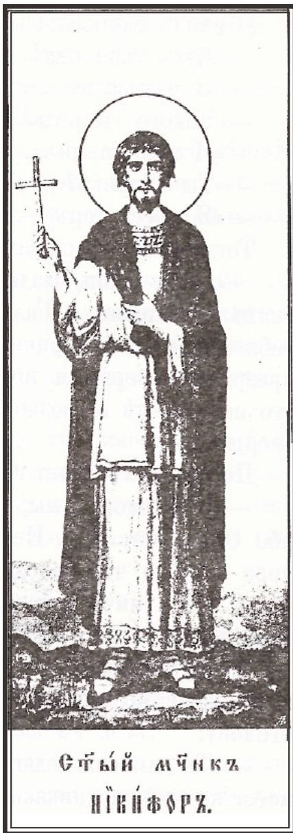
СВЯТЫЙ МОНАХЪ НИКИФОРЪ.

В ъ великой Антіохіи Сирійской, жили — нѣкій пресвитеръ, по имени Саприкій и прстець, — гражданинъ Никифоръ. Они питали другъ къ другу такую любовь и такъ были дружны, что нѣкоторые считали ихъ родными братьями.