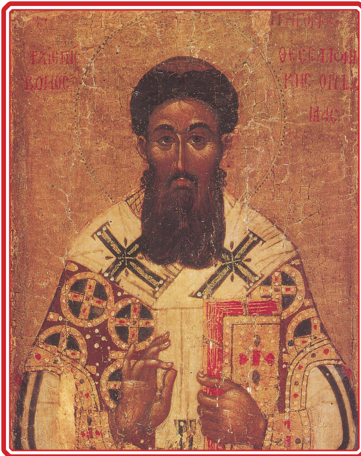
Святитель Григорій Палама Holy Hierarch Gregory Palamas

высокому религиозному служенію. Они желаютъ до конца и безраздѣльно отдаться служенію Богу, они живутъ только религиозной идеей, они служатъ только Церкви. Естественно ли имъ воспрещать такое цѣлостное и безраздѣльное служеніе? Богоматерь, Іоаннъ Креститель, Іоаннъ Богословъ, апостоль Павелъ — можно ли было ихъ принудить къ браку и семьѣ? Самъ Спаситель, совершеннѣйшій Человѣкъ, все воспріявшій человеческое отъ рожденія и младенчества до голода, страданій и смерти, однако, не имѣлъ семьи, ибо семьей Его былъ весь родъ человѣческій. И это не было нарушеніемъ законовъ естества.