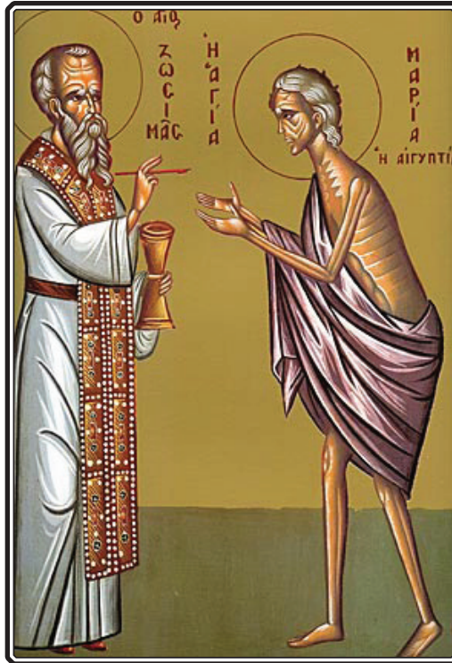
Saint Zosimas & Saint Mary

On his return to the monastery, he recounted the marvels that God had wrought for those who turn away from sin and move towards